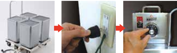
底面ヒーターにペール缶・一斗缶を乗せます。(最大4缶まで) コンセントにプラグを差し込みます。(100V) ダイヤルを回して温度を調節します。(150°Cまで)