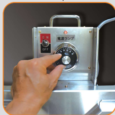
ダイヤルを回して温度を調節します。(110℃まで)