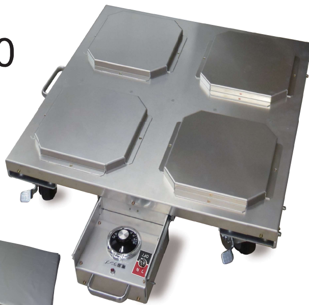
※断熱カバーは別売りです。