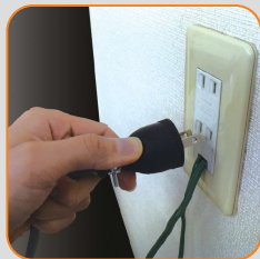
コンセントにプラグを差し込みます。(100V)