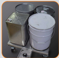
底面ヒーターにペール缶・一斗缶を乗せます。(最大4缶まで)