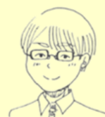
叶（入社十四年目） 趣味「アニメ鑑賞」