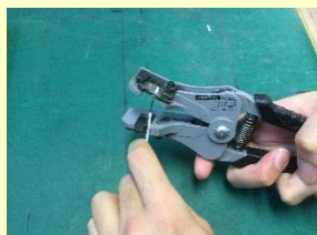
ストリッパーを使用 しているところ