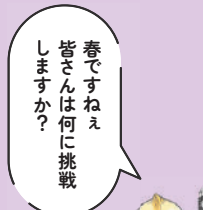
春ですなぁ 皆さんは何に挑戦 しますか？ 作「りえ」