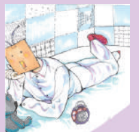
顔がラバーヒーターの 熱田(あつた) カイソウ