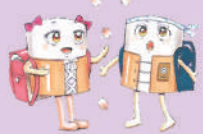
ドラム缶ヒーターの兄妹 どらむん・どらみん